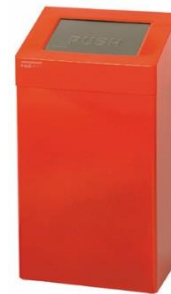
PP0020RAL / PP0050RAL acabado RAL